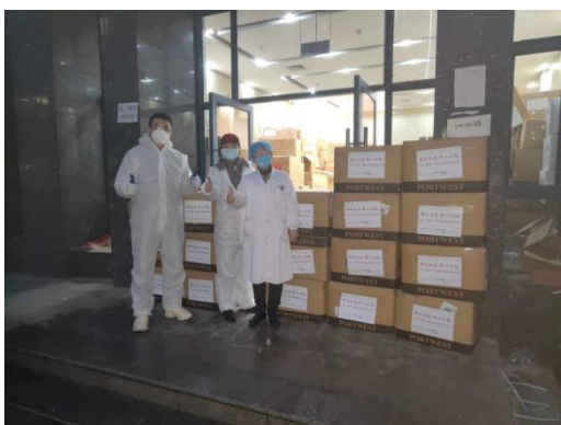
为医院募捐的防疫物资